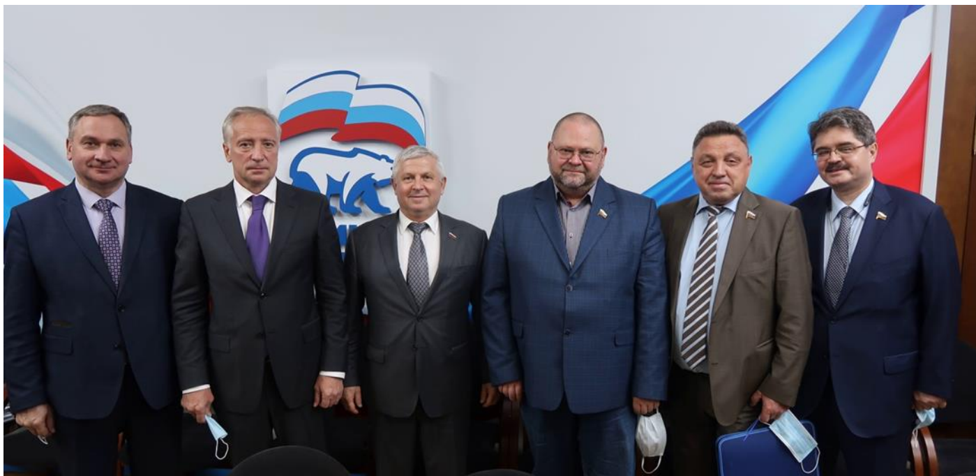
Фотографии и текст - Александр АЛЕКСЕЕВ.