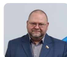
Первый заместитель Председателя Высшего Совета,